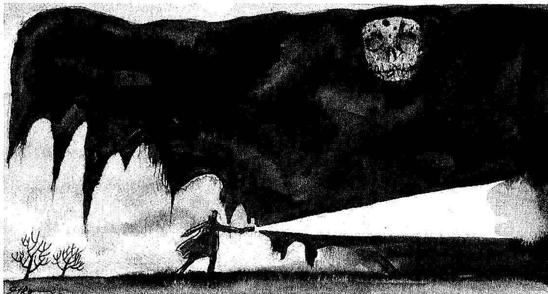
(DISEGNO DI FABIO SIRONI)